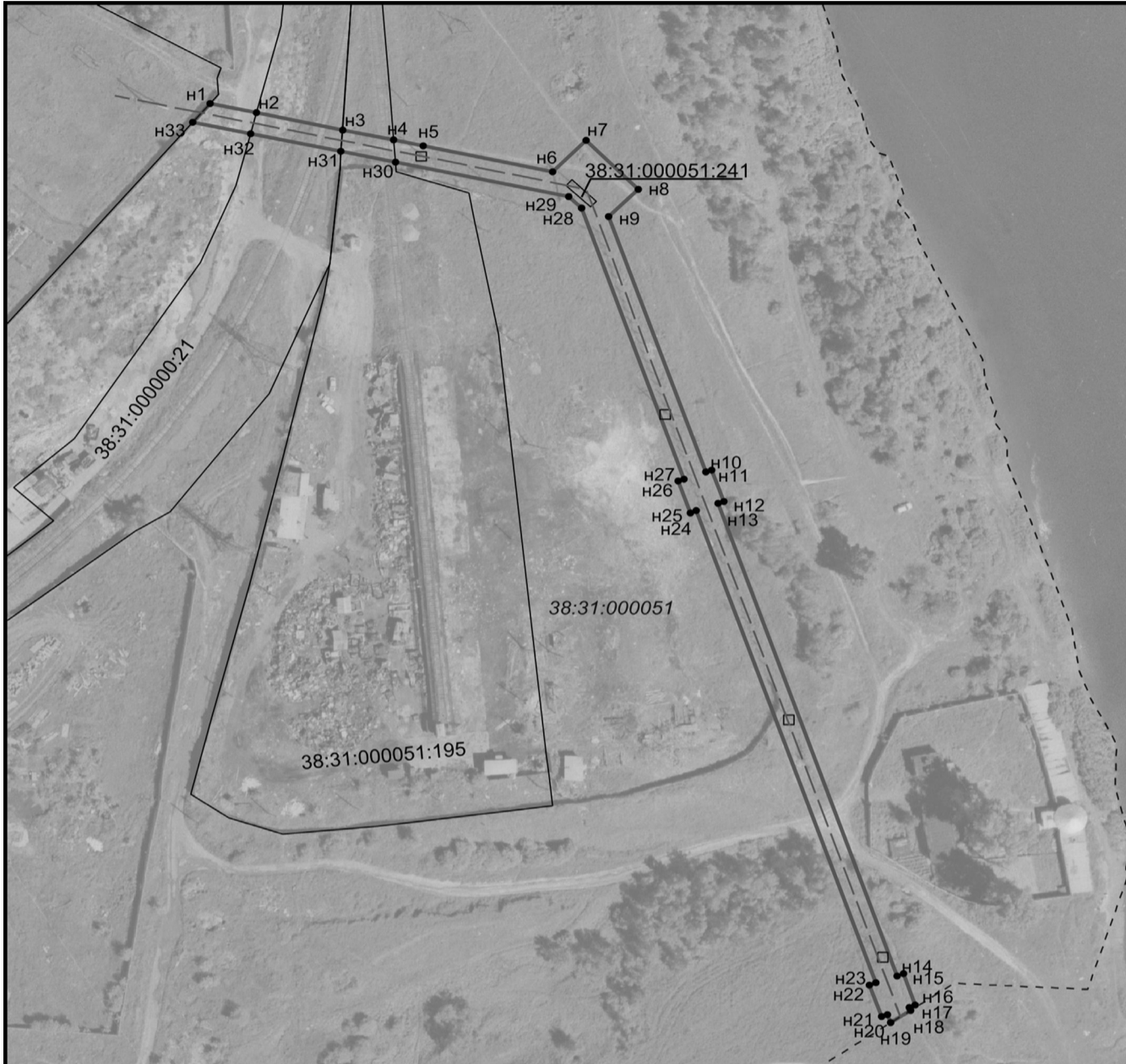
Схема расположения границ публичного сервитута Местоположение публичного сервитута: Иркутская область, г. Усолье-Сибирское Цель установления публичного сервитута: размещение линейного объекта «ВЛ-35кВ «ЗГО-Железнодорожник» Площадь устанавливаемого публичного сервитута: 2341 кв.м Система координат: МСК 38, зона 3