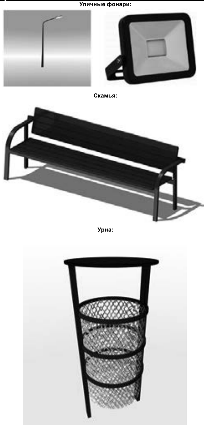
Приложение 2 к подпрограмме «Формирование современной городской среды» на 2017 год муниципальной программы города Усолье-Сибирское «Развитие жилищно-коммунального хозяйства» на 2015-2020 годы