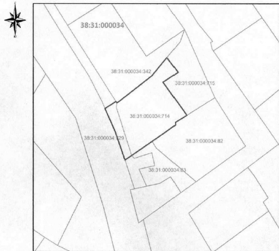
Схема расположения проектируемого земельного участка